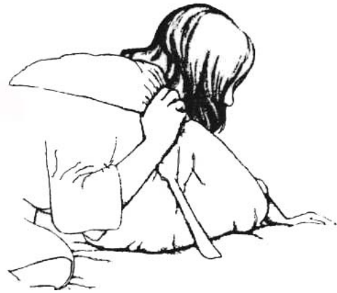
Vous pouvez déposer le bébé (surtout s'il est endormi) en vous glissant doucement hors du porte-câLLIn