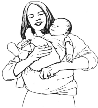
Installation de bébé dans la position kangourou