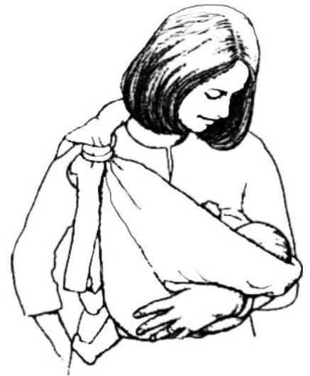
La position « en berceau » est la plus usitée pour allaiter bébé dans le porte-câLLlin