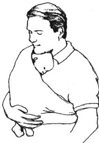
Au creux du cou de papa: une position très appréciée des bébés et très apaisante