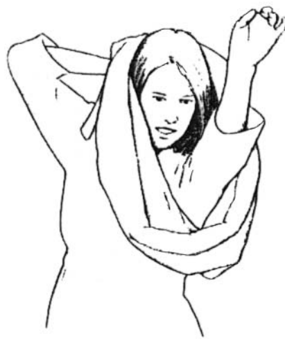
Comment enfiler le porte-câLLlin.