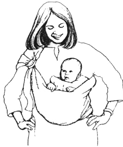
Position kangourou ou face au monde