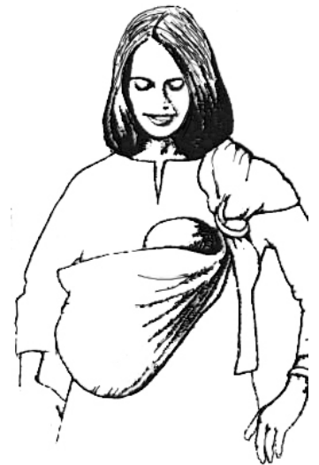
Bébé presque droit