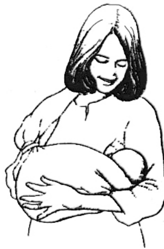
Enroulé autour de maman