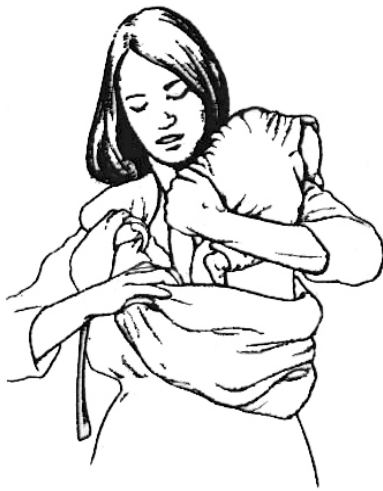
Installer bébé en position « blotti »