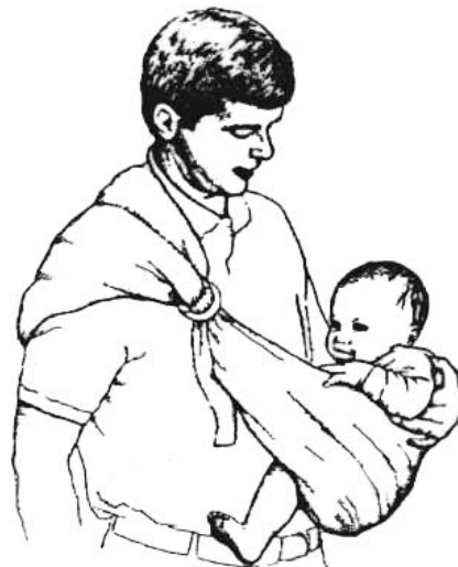
Sur la hanche (dès que le tonus de bébé le permet)