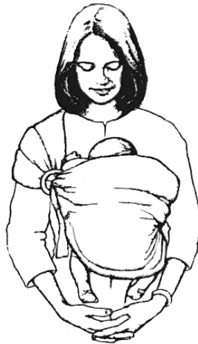
Position « blotti »