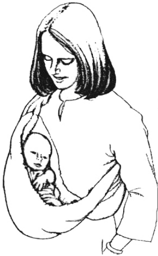
Une position « berceau » pour un nouveau-né